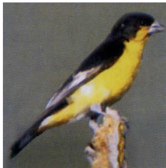
MACHO, SUBESPÉCIE DO C.PSALTRIA

Mais conhecido como "Pintassilgo Capa Preta", o Carduelis psaltria ocupa um lugar de destaque na família dos pintassilgos ( Carduelis ). Este pássaro é encontrado desde o sul dos Estados Unidos até o norte da América do Sul, em países como Equador, Venezuela e Guianas. No entanto o psaltria é endêmico da América Central, principalmente México. O Carduelis psaltria possui um porte médio de aproximadamente 11 cm, tanto os machos quanto as fêmeas. O macho apresenta a cabeça e as costas pretas, o pescoço, peito e ventre são amarelo ouro, o bico e as patas são amarelos acinzentados. A fêmea apresenta um tom verde oliva, asas acastanhadas e o ventre levemente amarelado, bico e patas amarelo acinzentado.