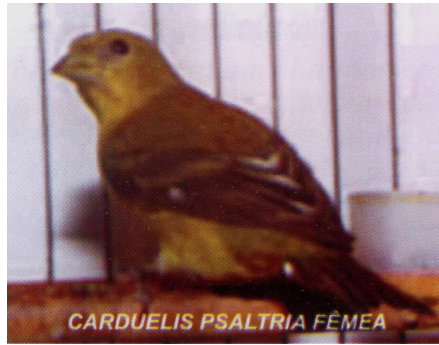
CARDUELIS PSALTRIA FÊMEA